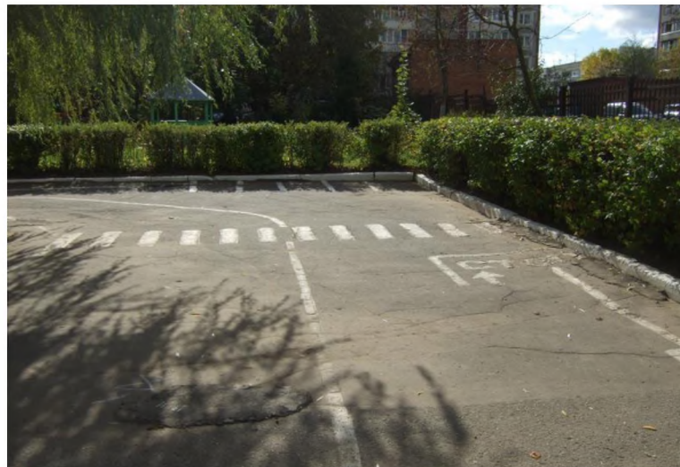
Фото на странице: - 3